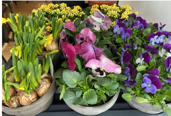
Forårsblomster til patientterrasserne fra Støtteforeningen