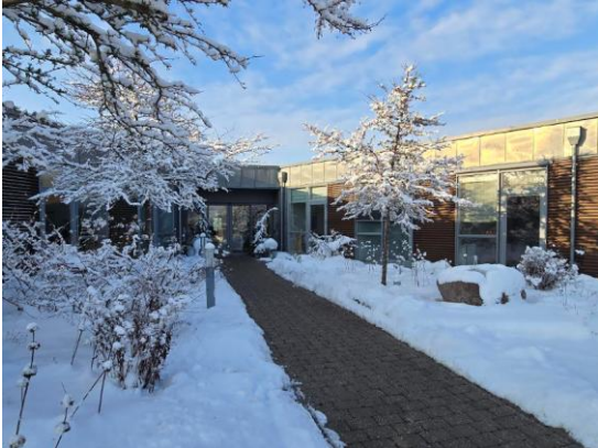
Et snedækket Hospice Sjælland

Siden sidste nyhedsbrev er vi gået fra vinter til forår. Dagene er blevet længere og lysere, og noget tyder også på, at der snart er lidt lunere temperaturer på vej.