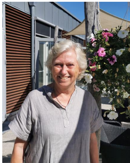
Vibeke en solrig sommerdag

Disse arrangementer er betalt af Hospice Sjællands Støtteforening. Det er vi meget taknemmelige for.