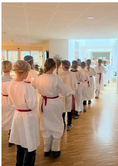
Elever fra Kristofferskolen

Desuden fik vi i december besøg af dygtige elever fra Kristofferskolen, som gik det fineste Luciaoptog gennem hospice og til sidst i spisestuen supplerede med et par ekstra julesange. En dejlig stemningsfuld dag.