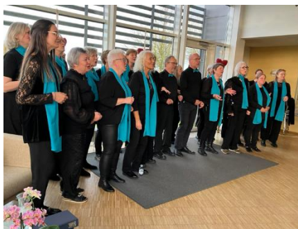
Roskilde Gospel Singers

Traditionen tro var der i 2025 arrangeret musikalske oplevelser hver advents-søndag, hvor der også blev serveret gløgg og æbleskiver.