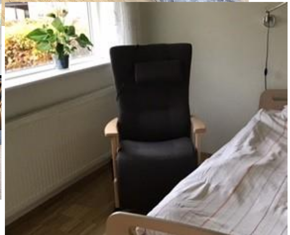
De nye stole passer så fint på patientstuerne