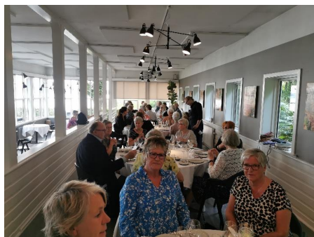
Sommerfest for de frivillige

Jeg står også for arrangementer for de frivillige, bustur til andre hospicer, cafemøder hvor vi hører om hvad der sker i vores hus. Vi har holdt sommerfest. Der var flere frivillige, der deltog i den nationale hospicedag og var dermed en vigtig del i, at vi har fået flere frivillige.