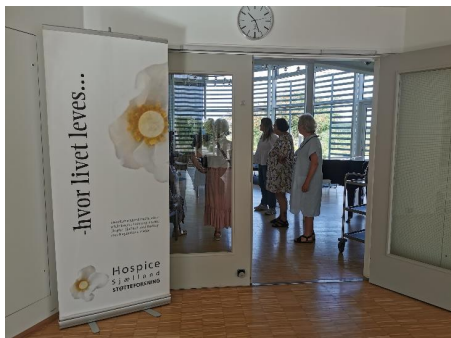
Fra den nationale hospicedag i september

For mig er de frivillige den hverdag vores patienter er afskåret fra, de kommer med hver deres personlighed og hver deres historie. For mig er den forskellighed meget vigtig. Det giver et bredt og nuanceret input til vores patienter. De frivillige udfylder mange forskellige roller. Der er nogen der er måltidsværter, der er nogen der cykler med vores Rickshaw, der er nogen der passer vores blomster i huset, der er nogen som kommer og spiller klaver, bager pandekager eller går med drinksvognen som forkæler vores patienter. Jeg kan sagtens nævne flere ting. Men essensen er, at de alle gør noget godt for vores patienter.